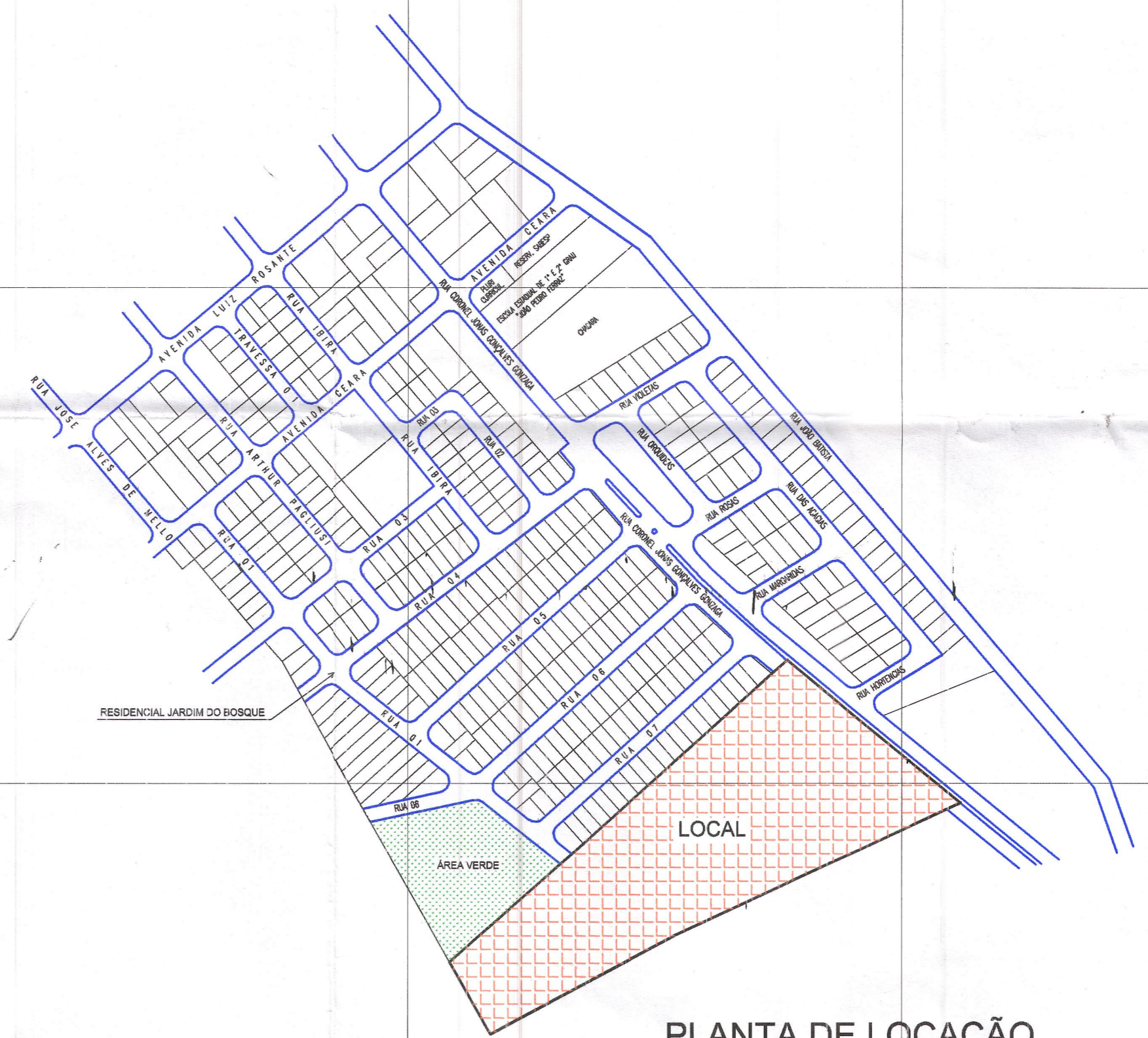
PLANTA DE LOCAÇÃO SEM ESCALA